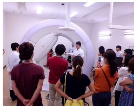
四次元放射線治療装置見学の様子（2015 年）

公益財団法人 医用原子力技術研究振興財団 担当：上村 住所：〒103-0001 東京都中央区日本橋小伝馬町 7-16 ニッケイビル 5 階 URL： http://www.antm.or.jp/ E-mail： ops@antm.or.jp TEL：03-5645-2230 FAX：03-3660-0200