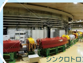
シンクロトロン加速器